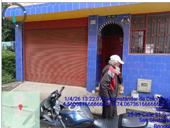
VISTA FRONTAL PREDIO