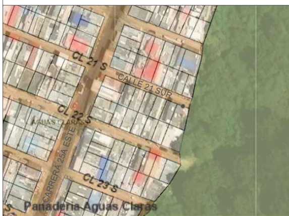
LOCALIZACIÓN PREDIO CALLE 21 SUR # 25A - 45 ESTE