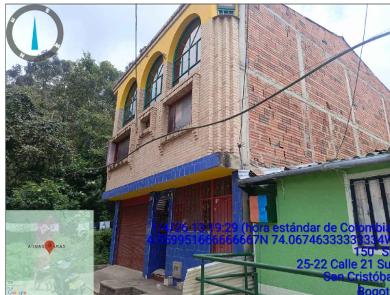
PERSPECTIVA GENERAL PREDIO